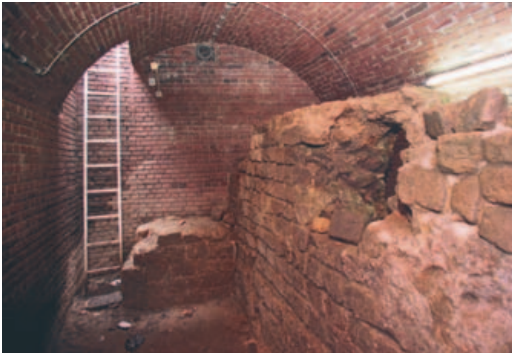
De bijna 2000 jaar oude Romeinse muur in een kelder achter de Muziekschool aan het Domplein.

Domplein: zichtbaar maken van de in het verleden opgegraven delen van de Kruiskapel en Salvatorkerk. Verder het blotleggen van een Dompilijer.