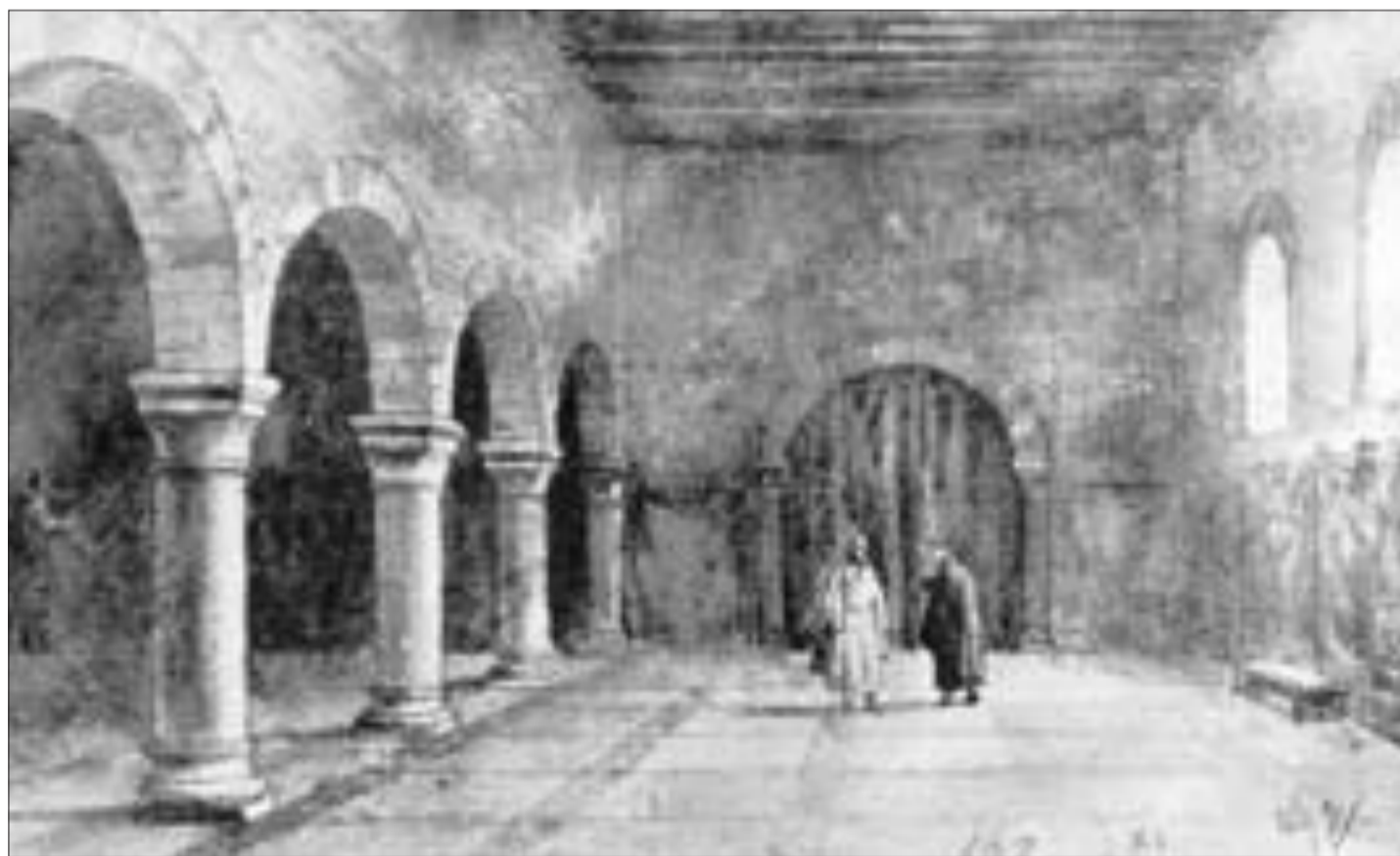
Het middeleeuwse paleis Lofen zoals dat er waarschijnlijk uit heeft gezien.

Daarvoor is het wel nodig dat de eeuwenoude resten goed worden geconserveerd en bestand zijn tegen licht en lucht. Vorig jaar bleek het metselwerk van de 2000 jaar oude Romeinse muur achter de Muziekschool aangetast te zijn door va-