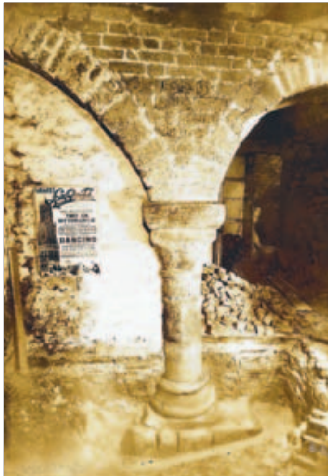
Een zuil van paleis Lofen onder een pand tussen de Vismarkt en het Domplein. De foto is uit 1931 toen de zuil eenmalig werd uitgegraven.

Eerder dit jaar zei burgemeester Brouwer bij een toespraak dat het Domplein niet alleen een lokale aangelegenheid is, maar ook een cultuurhistorisch centrum met Europese dimensies. De muur van het Romeinse castellum is een van de oudste Nederlandse archeologische res-