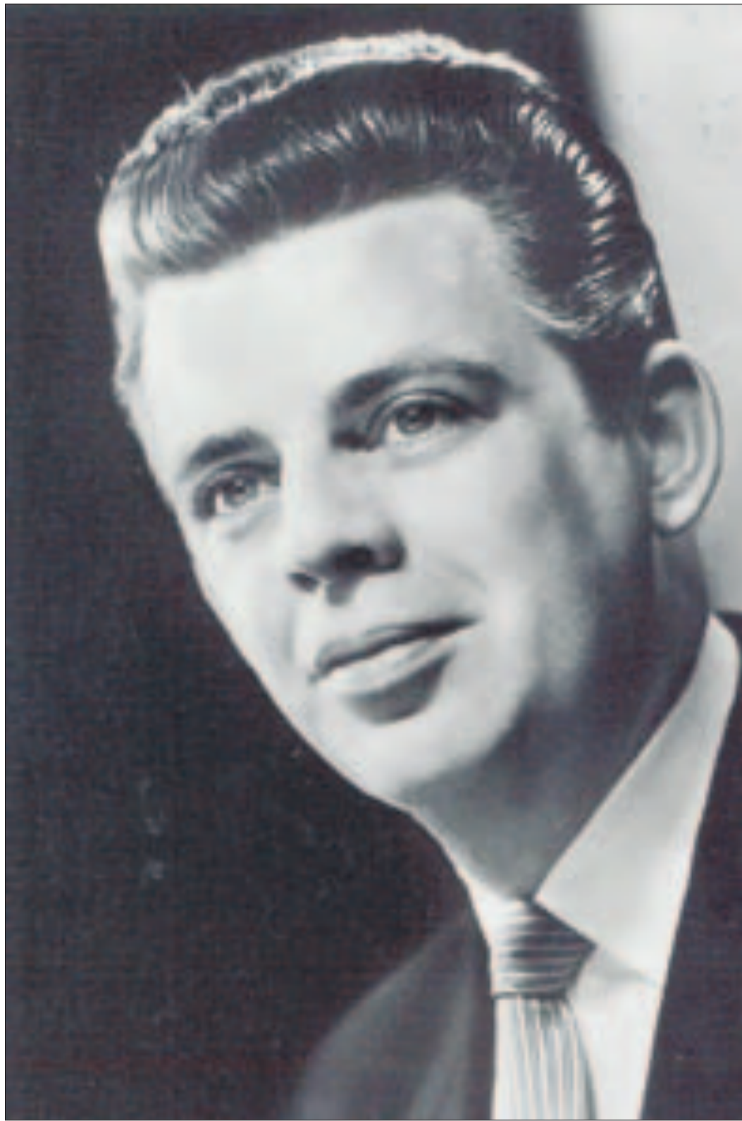
Een artiestenfoto van Reynolds in de jaren vijftig.

Reynolds krijgt ook kleine rolltjes naast de populaire clown. Hij valt daarmee op zodat hij ook voor kleine bijrolletjes in andere tv-komedies wordt gevraagd.